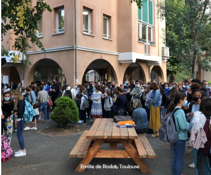
Emilie de Rodat, Toulouse

Une nouvelle fois, tout a été mis en œuvre dans nos établissements pour commencer une bonne année scolaire ! Merci pour tout le soin apporté pour que chacun se sente accueilli, et puisse ainsi accueillir avec confiance l'année qui se profile : des temps de retrouvailles, un goûter pour les nouveaux élèves de 6ème, des petits mots de bienvenue avec des manuels tout neufs,... Les 1000 petites et grandes attentions déployées partout sont autant de témoignages de l'amour de Dieu pour chacun, source de tout projet, de tout progrès, de toute joie !