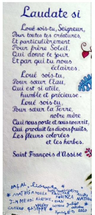
Prière apposée à la fresque, avec la signature de tous les artistes