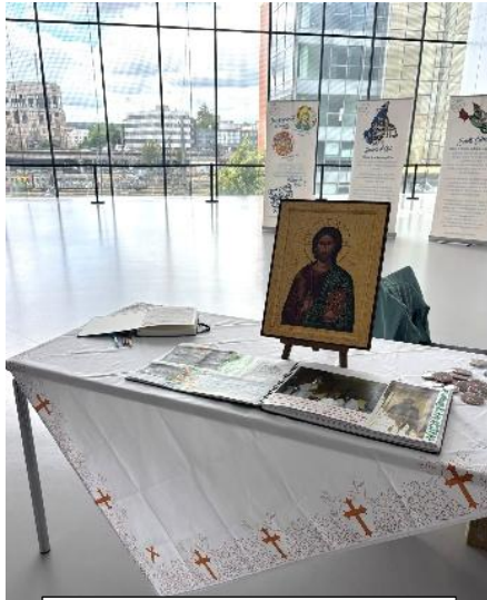
L'icône était du voyage