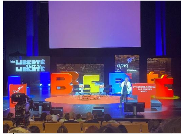
Une des nombreuses conférences