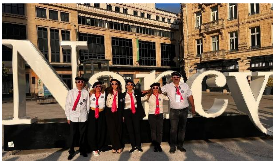
L'équipe de l'Apel 31