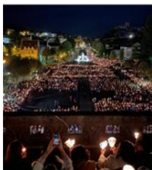
Pèlerinage du Rosaire

-La beauté de l'esplanade avec la foule, les processions.