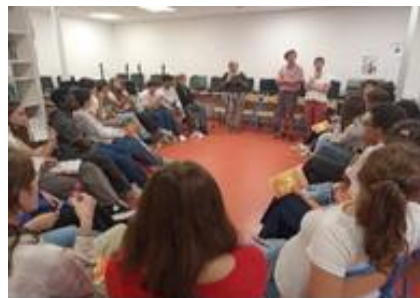
Temps fort confirmation avec Annuncio

Chaque groupe poursuit dans son collège la préparation, et les prochains rendez-vous communs seront le temps de retraite, la rencontre avec l'évêque et la célébration.